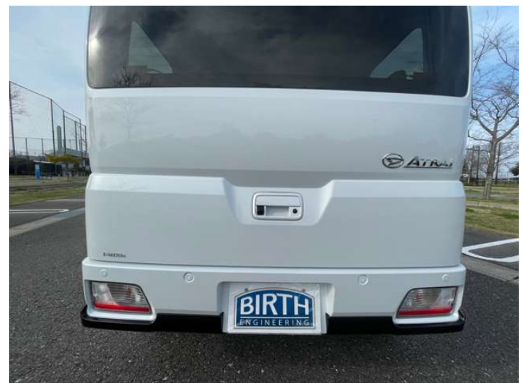
ブレーキ制御付誤発進抑制機能（前方・後方）約10 km/h以下で障害物を認識後、踏み間違いを判定してエンジン出力を抑制し、障害物に衝突する危険性があるとシステムが判断するとブレーキ制御が作動します。