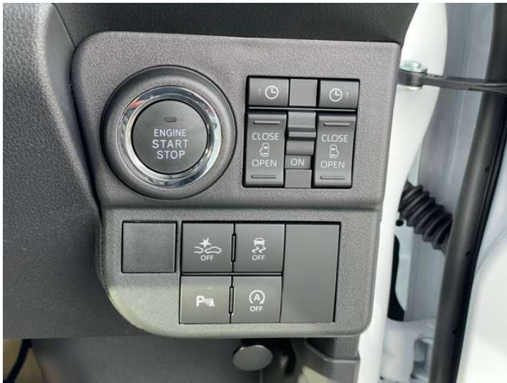
予約付き両側パワースライドドア・エンジンプッシュスタート