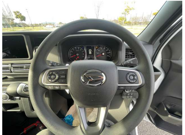
全車速追従機能付ACC アダプティブクルーズ・走行中に先行車の様子を検知しながら、設定した車速の範囲内で先行車との距離のキープを支援します。疲れにくく、長距離運転中の渋滞なども快適に運転できます。