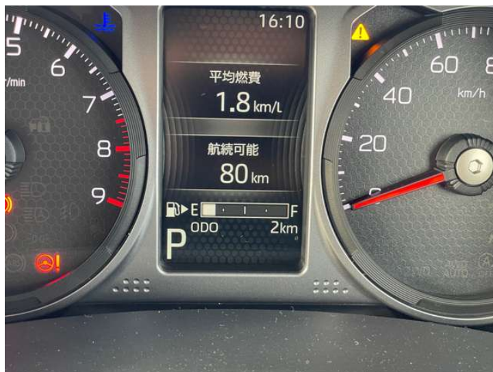
2眼メーター（タコメーター付）& TFTカラーマルチインフォメーションディスプレイ