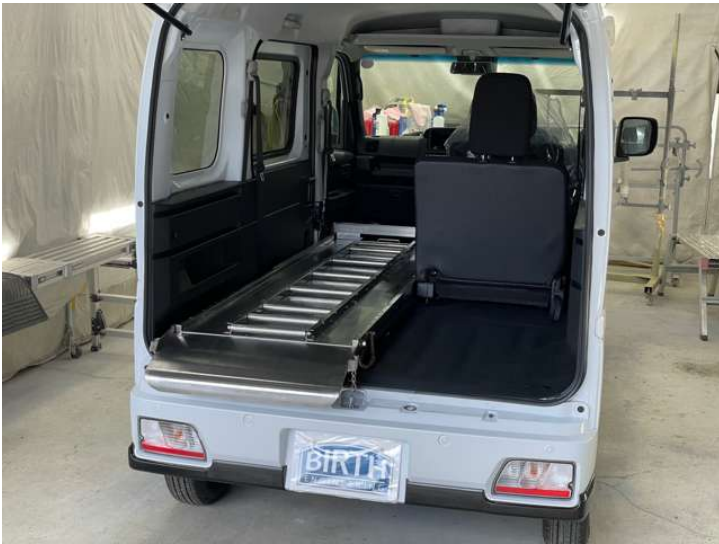
固定式ストレッチャー・棺兼用棺台レール（中古品）