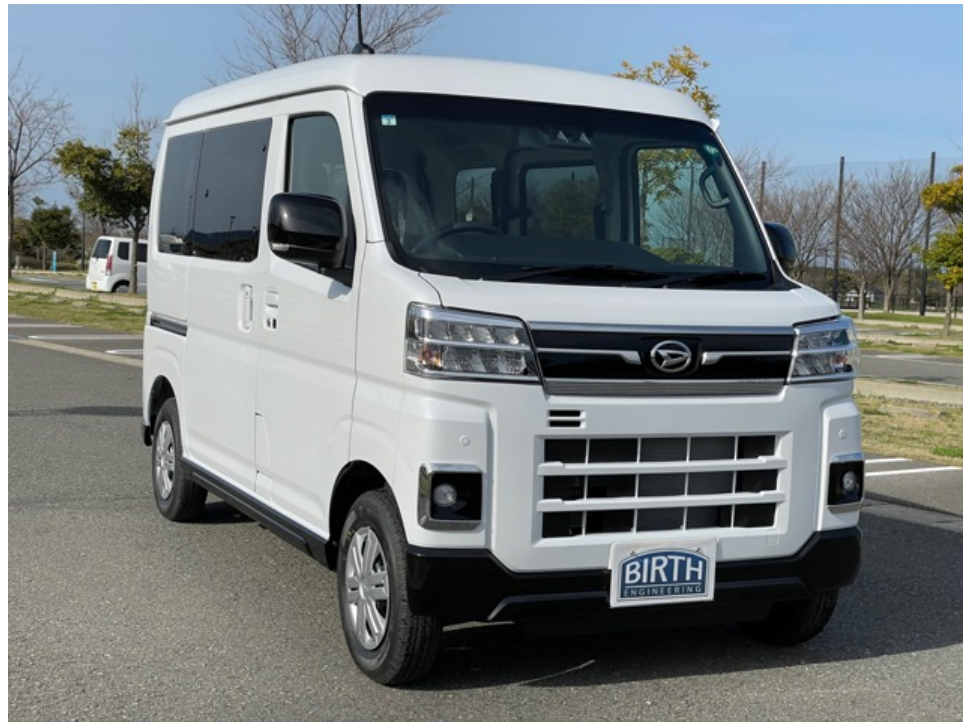
新型アトレー・霊柩車・患者輸送車・2名乗り・ボディカラーメーカーオプション：パールホワイト